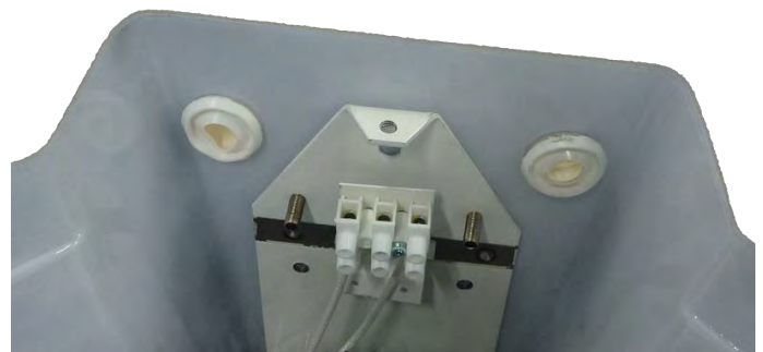
Figur 2: Insida av armatur